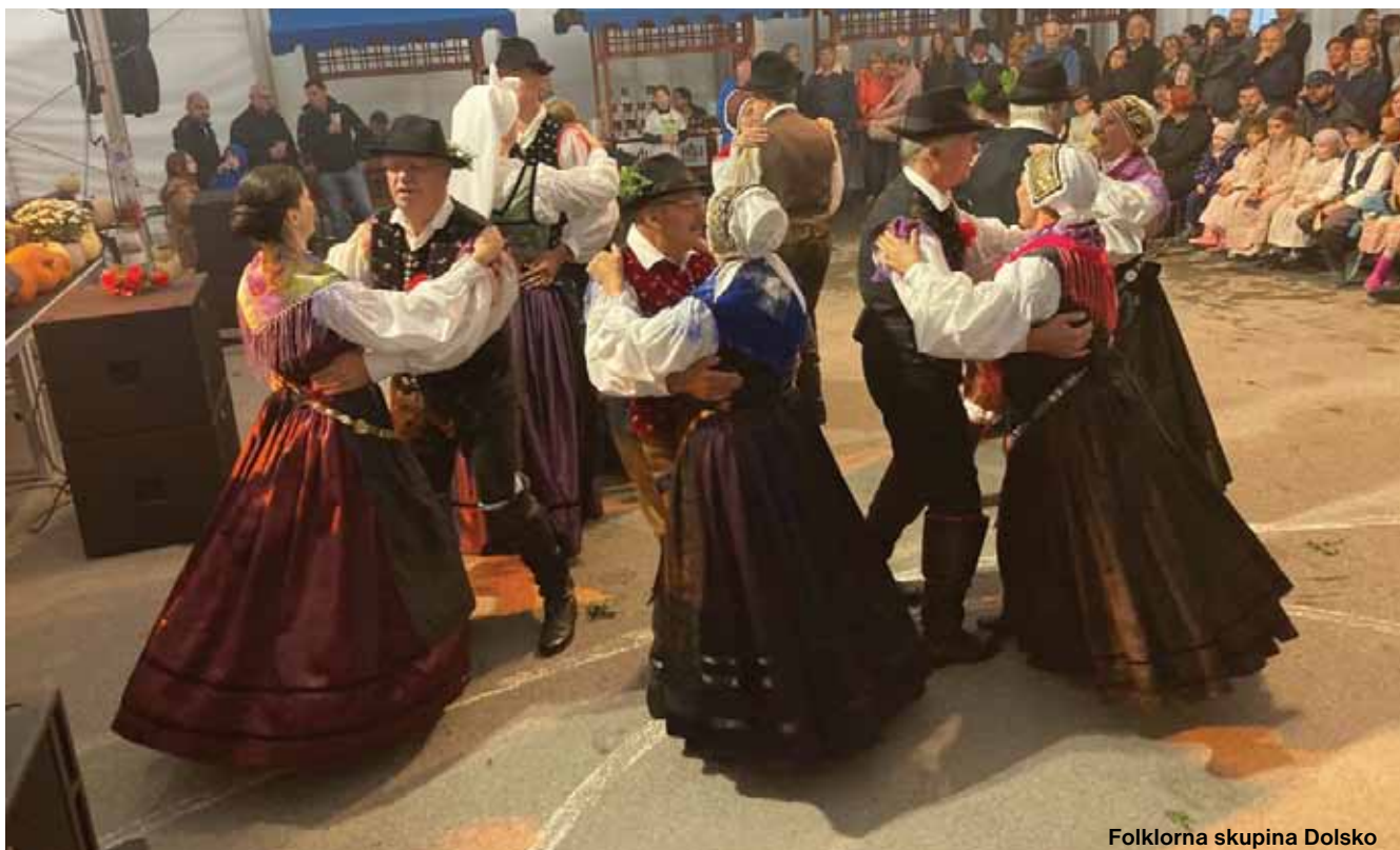
Folklorna skupina Dolsko