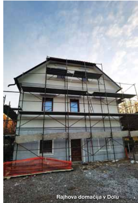
Rajhova domačija v Dolu