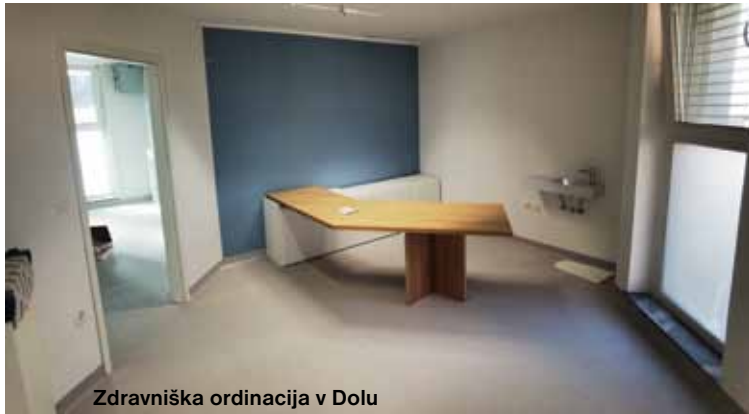
Zdravniška ordinacija v Dolu