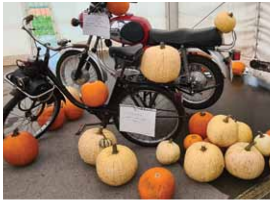
Za dekoracijo z bučami so poskrbeli Pr' kozolcu.