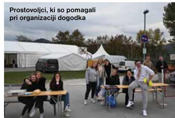
Prostovoljci, ki so pomagali pri organizaciji dogodka