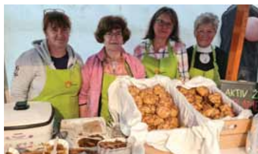
Aktiv žena Plamen