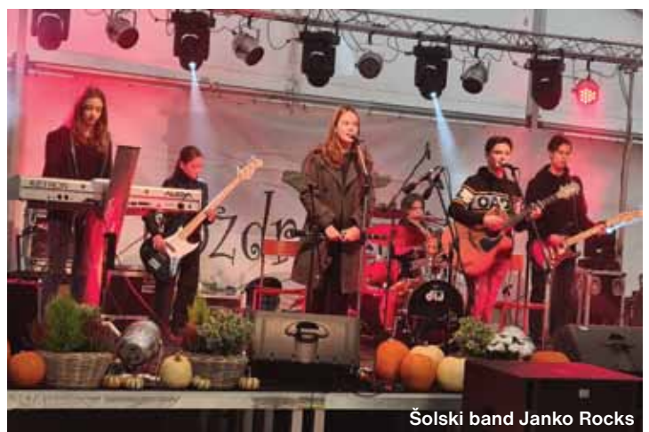
Šolski band Janko Rocks