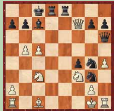
Primer 1: črni na potezi. Mat v 4.

Vabljeni, da se preizkusite v vaših šahovskih sposobnostih. V vsaki številki se spoprijemamo s tremi šahovskimi problemi, ki so razvrščeni po težavnosti. Ob vsaki šahovski poziciji je na voljo tudi kratek opis problema. Rešitve ugank bodo objavljene v naslednji številki. Veliko uspeha pri reševanju!