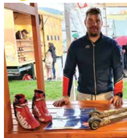
Tekaško smučarski klub Dol