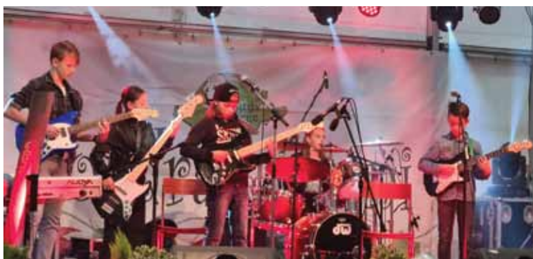
Šolski band Rock'n'Dol