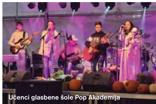
Učenci glasbene šole Pop Akademija