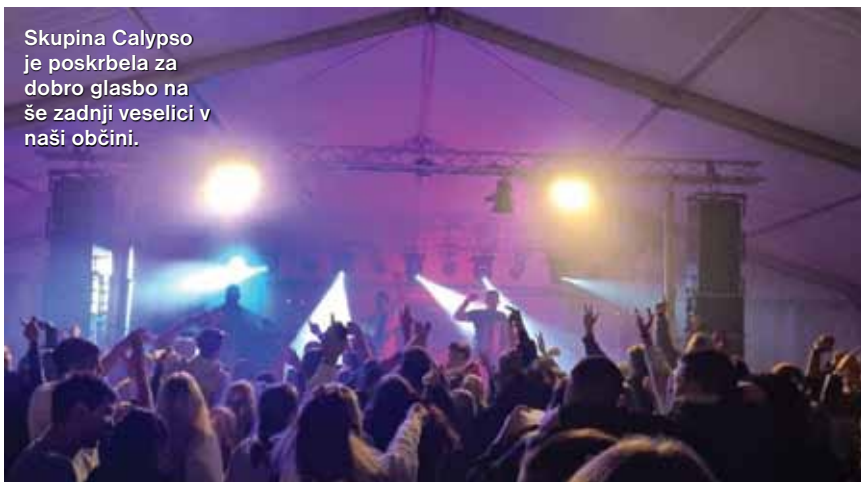
Skupina Calypso je poskrbela za dobro glasbo na še zadnji veselici v naši občini.