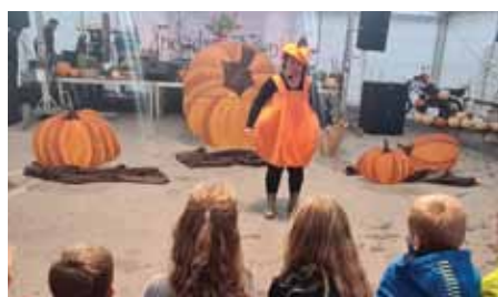
Predstava za otroke Gledališča Pravljíčarna