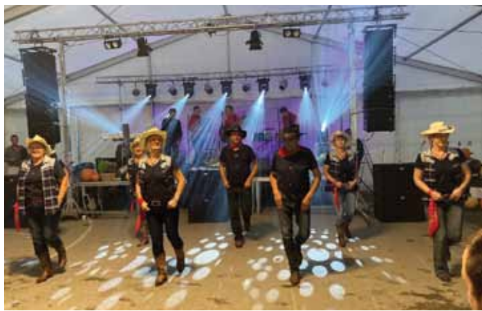
Country plesna skupina B&B