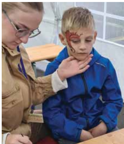
Animacija za otroke, poslikava obraza in slikanje na panjske končnice