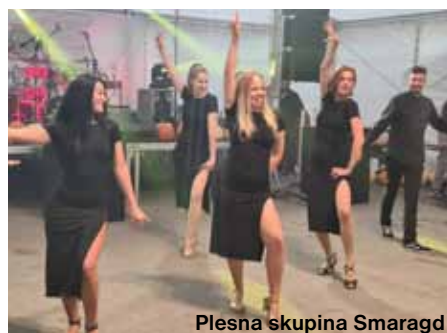
Plesna skupina Smaragd