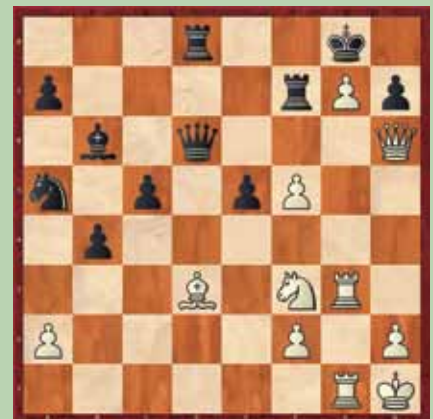
Primer 2: beli na potezi. Mat v 5.