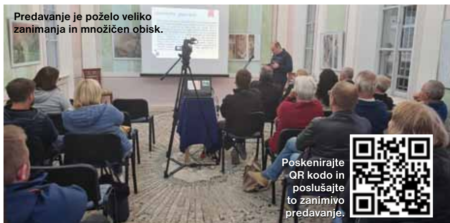
Predavanje je poželo veliko zanimanja in množičen obisk.