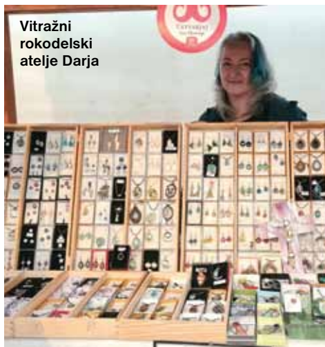
Vitražni rokodelski atelje Darja