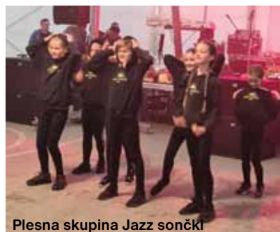
Plesna skupina Jazz sončki