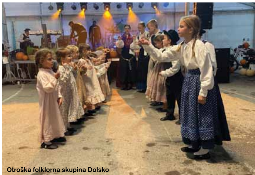
Otroška folklorna skupina Dolso