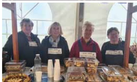
Aktiv žena Marjetice