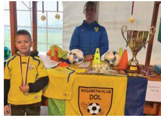
Nogometni klub Dol